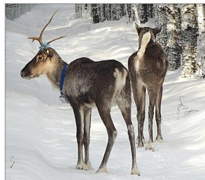
Северные олени Тоша и Елисей

Для выполнения работ по мониторингу свободноживущих оленей взаимодействуют несколько сотрудников заповедника. Один из специалистов, находясь в зоне устойчивого интернет-доступа, в режиме онлайн прослеживает перемещение животных, снабженных ма-