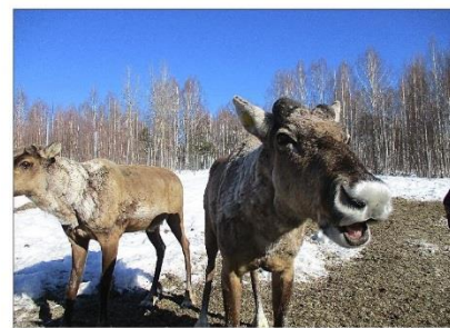
Лесные северные олени в Черноречье

Наблюдать за природой и любоваться ее красотами могут не только сотрудники заповедника. К ним могут присоединиться все желающие – и начнется горячая пора у отдела экологического про-