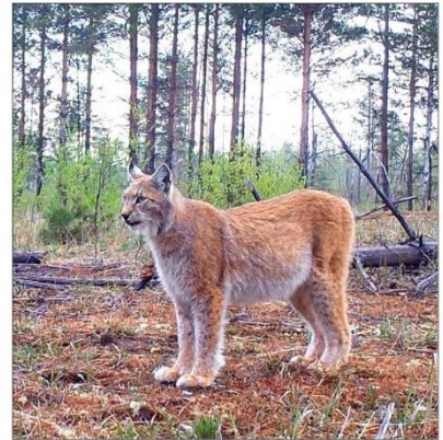
Рысь в Керженском заповеднике

В большинстве случаев стоянки не обходятся без костров, разведение которых в заповеднике запрещено законом. Так что весна и лето для сотрудников отдела охраны не только горячая, но и «горячая» пора.